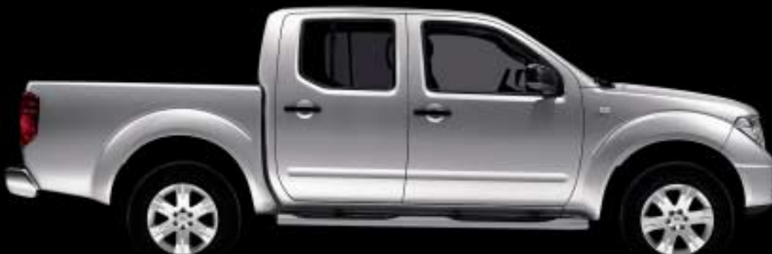
Abb. zeigt Navara