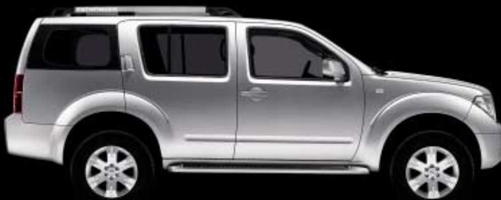
Abb. zeigt Pathfinder