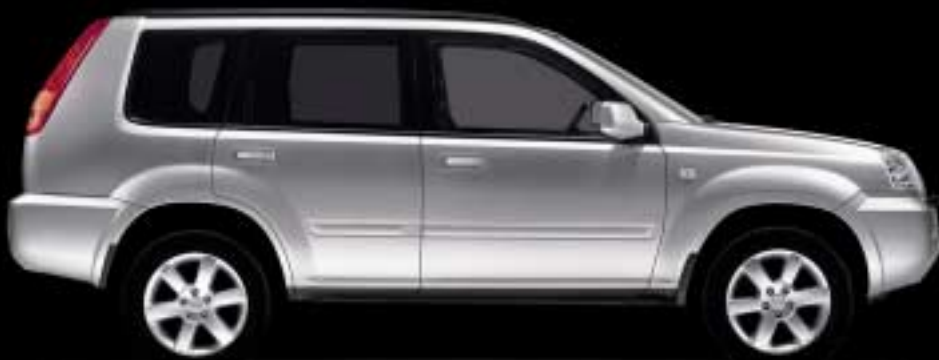
Abb. zeigt X-TRAIL